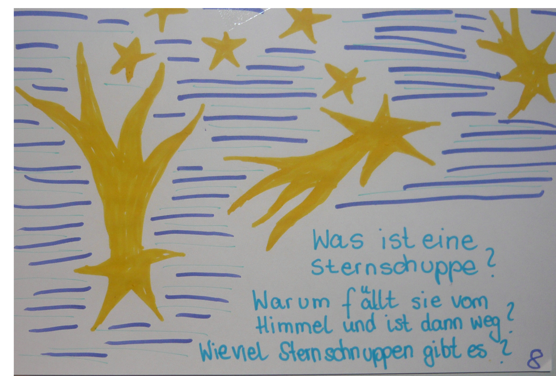
Was ist eine Sternschnuppe?

Und am Ende gab es eine zauberhafte Regenbogenmodenschau. Die Jury hat dafür einen der vier 3. Preise verliehen.